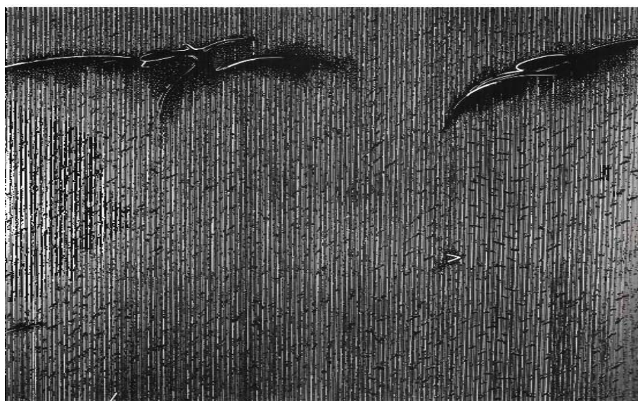
Aki KURODA, ( conti/NUIT/é ) IV, 1980. Avec l'aimable autorisation de l'artiste (droits réservés).

sous la direction de Yann MÉVEL et Tsutomu IMAI